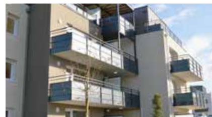
LIFFRÉ (35) , résidence Thasos - 12 logements.