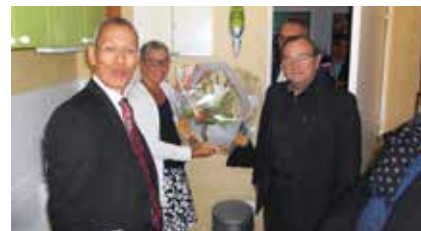
VEZIN-LE-COQUET (35) , résidence Le Vezinet - réhabilitation de 24 logements.