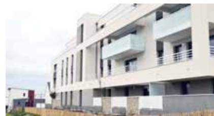
SERVON-SUR-VILAINE (35) , résidence L'Iroise - 25 logements.