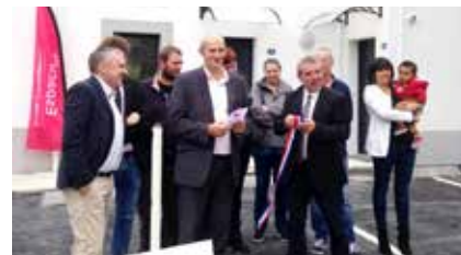
LE HÉZO (56) , résidence Le Bois du Rohic - 4 maisons.