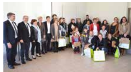
BÉDÉE (35) , résidence Ar Stériou - 17 logements.